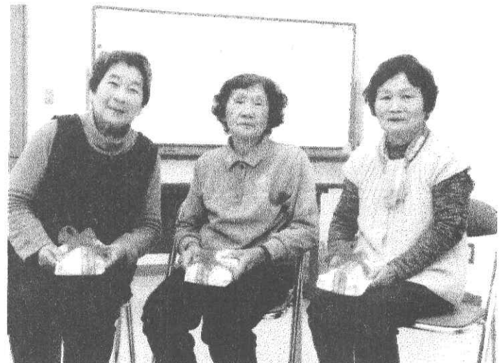
3月の誕生日の方 いつまでもお元気で

4月10日(火)の富士登山に参加される方にお知らせです。70才以上の方は入場料を頂けません。但し、70才であることを証明するものが必要です。保険証のコピーか免許証のコピーをお持ちください