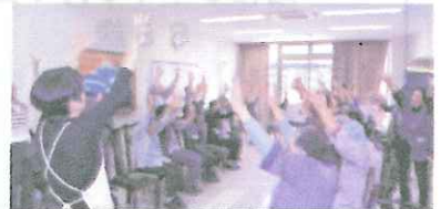
まずは「おこやかエブリデイ」でウオーミングアップ