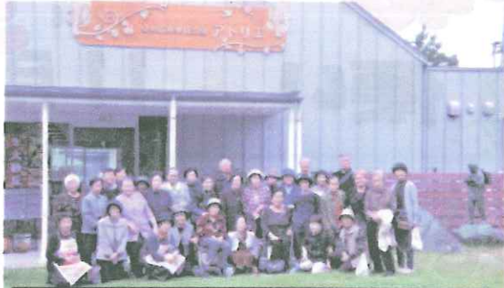
公園散策後みんな揃ってハイ・チーズ!