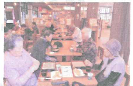
←↑ 森パーキングエリアでの食卓風景「いただきます」