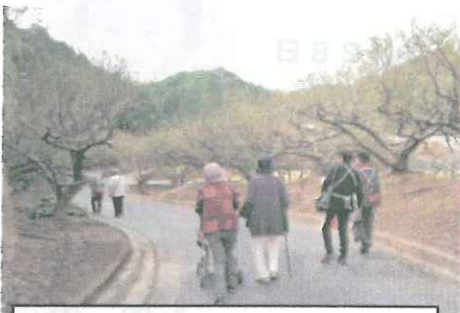
台風で葉の落ちた「梅エリア」