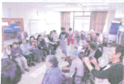
皆さん頑張りましたね