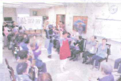
←会長も頑張っています