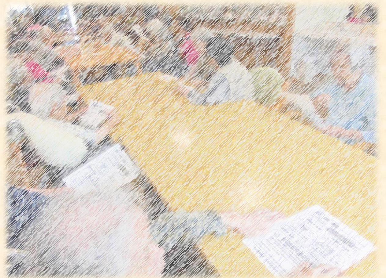
牧之原市社会福祉協議会 デイサービスセンターうたり