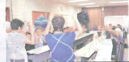
今日も手話の練習は忘れません ♪うさぎおもしろのやま〜