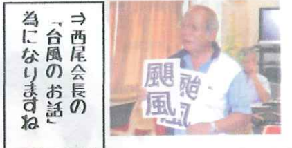
→西尾会長の「台風のお話」 為になりますね