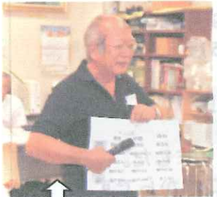
↑西尾学習塾? 「お・い・あ・く・ま」について 為になりますね。