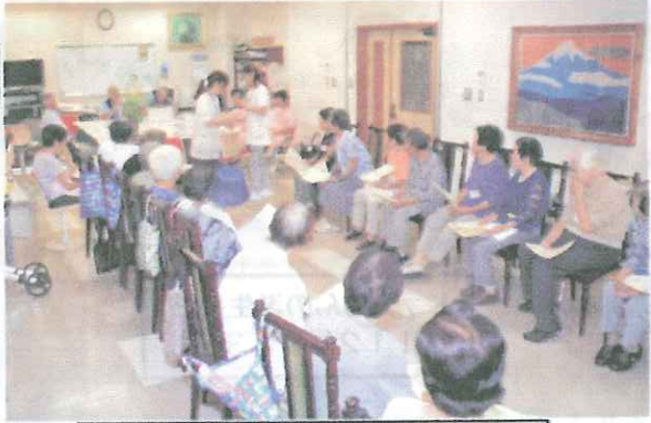
皆さん真剣に受講されましたね