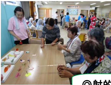
◎射的・スイカ割り