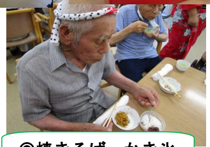
◎焼きそば・かき氷